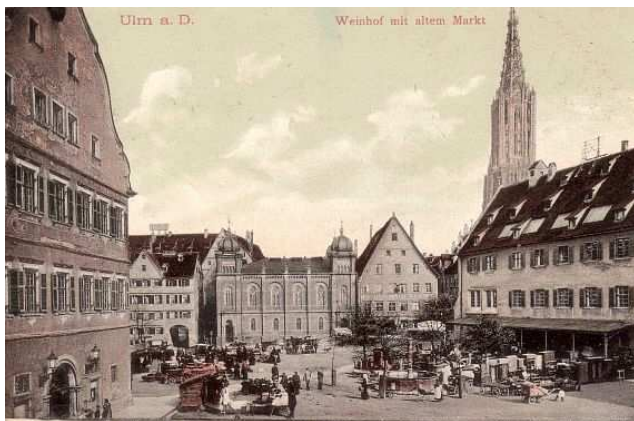
Blick nach Nordost über den Weinhof zur alten Synagoge (Postkarte aus der Zeit vor 1927) ★

Städtebaulich ergeben sich auf dem Weinhof mit dem Neubau eine ganz neue Situation, wie Baubürgermeister Alexander Wetzung auf der Sitzung am 5. Mai 2009 gegenüber dem Hauptausschuss ausführte. Denn der Platz, der noch nie bebaut gewesen sei, weise in seinem Gefüge noch eine große Wunde des letzten Krieges auf, die nun durch den Gemeinde-neubau behoben werden könne.