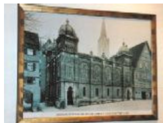
Bild von der alten Ulmer Synagoge am Weinhof, die 1938 zerstört wurde

Dass dieses Projekt über das Entwurfsstadium hinaus kommt, darum kümmert sich ein neu gegründeter Verein: der „Förderverein zur Unterstützung des Baues einer neuen Synagoge in Ulm e.V.“.